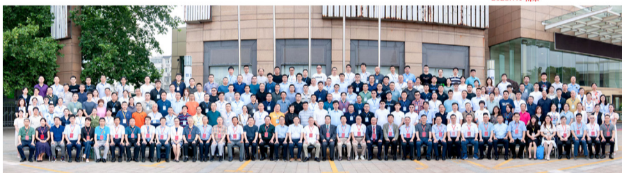
中国中医药研究促进会针刀疼痛康复分会成立大会合影

位同仁的积极推荐、共同努力下,会共同为针刀学科长足发展做出更大贡献,为中医药事业发展再添新功!