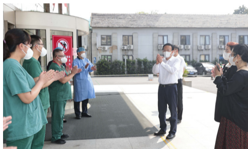
南京市委副书记、代市长夏心旻到我院支援南京市公共卫生中心医疗队驻地慰问