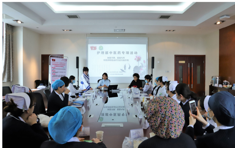
3月23日,我院组织了以“和而不同,美美与共”为主题的特色中国沙龙活动。活动在国医沙龙拉开序幕,来自经典病房、重点专科的护士代表详细介绍了中医特色护理技术,有中药热敷包、中药外敷膏、茶饮、脐贴等。随后,各位中药师从保存和舒适度上对中医护理技术提出改进建议。参与活动的人员纷纷表示,此次活动创新了中医药文化传播的内容及形式,在舒缓的古筝曲中交流成果、愉悦身心,既提高了护理人员科研能力及水平,也加强了中医特色护理技术的推广应用。(护理部)