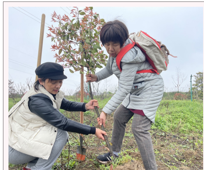
3月20日,工会联合团委组织了“三月植树节”活动,60多名职工前往溧水参与植树。现场,大家扶苗、铲土、填坑,配合默契,热情高涨,为溧水区的春天增添一抹新绿。(团委)

江苏省中西医结合医院新设“五高”门诊,由内分泌科刘超教授亲自坐诊。同时,为了更好的服务患者,“五高”门诊还开创了由心内科专家、营养科专家、康复运动专家、临床药学专家、护理专家联合参与的“共同照护”服务模式,组成多学科会诊阵容。并通过小组讨论的“共享门诊”形式,让专家和患者之间、患者和患者之间在交流中获得一些更好的治疗经验,以新型医疗模式为传统医疗赋能,给患者提供更加全面周到的一体化诊疗服务。(宣传统战部、内分泌科)