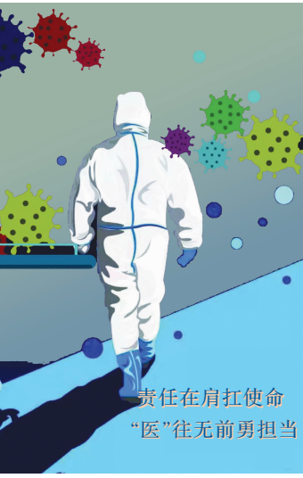
责任在肩扛使命 “医”往无前勇担当

为深入贯彻落实省卫生健康委关于节前安全生产的要求 ,确保我院安全生产工作平稳向好,2020年4月30日上午,在全院各部门自查、分管院长分片检查的基础上,对各部門安全生产工作进行了督导检查,各科室、学药部、总务科、采购中心、科技处、基建科等部门相关人员参加了本次督查。