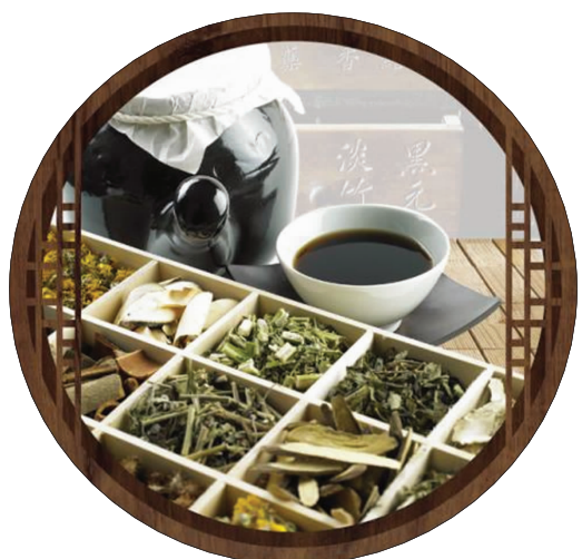
戒之! 此生所愿,遵从内心,无问西东,认真地做一名中医,继承和传承中医。(消化科 武科选)