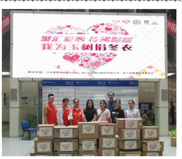
2019年9月12日,我院联合浙江佐力药业股份有限公司、浙江省壹善慈善基金会发起“我为玉树捐冬衣”活动。全院职工热情参与,当天上午短短3个小时,募集到冬季衣物32箱。一件件冬衣,一份份“心”的温暖,已经送往海拔4500米高原的学生和牧民家中。不忘初心,传递温暖,我们一直在路上!(团委)

由于讲座内容与收费员日常工作息息相关,活动现场收费员听得很认真,活动现场气氛高涨,这次讲座提高了收费员对人民币防范意识和鉴别技能,取得了良好的效果。(财务科)