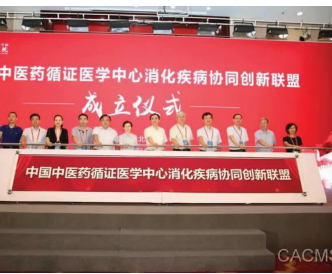
余万元。获得中华中医药学会科学技术奖1项,省厅与市级科学技术奖4项,完成成果转化1项,发表论文200余篇,SCI、EI收录20余篇,编写专著7部。(消化科)

协同工作机制,开展协作单位的技术指导和方法学培训。我院消化科为国家临床重点专科(中医专业)、国家中医药管理局十二五重点专科、江苏省中医重点学科(脾胃病学)、江苏省中医重点专科。拥有全国名老中医传承工作室,全国和省老中医药学术经验继承工作指导老师各1人,硕博生导师7名。科室先后主持承担了第二批国家中医临床研究基地重点病种研究方向之一、国家“十一五”科技支撑计划、国家及省自然科学基金、省重大科技项目等30余项,科研经费达1000