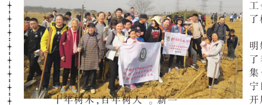
此次参加植树活动人员近百人,上至88岁老专家,下至6岁