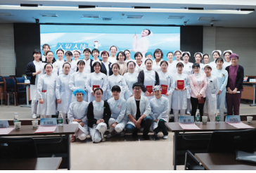
全防护知识,极大地提高了全院医务人员的职业安全防护能力,敲响防御的警钟!