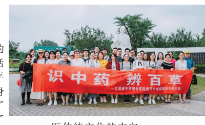
医传统文化的志向。(医务处 规培办)

详但又从未一睹真容的珍稀中药材。通过此次活学,学员们不仅释放了平日学习的压力,愉悦了身心,增长了见识,开拓了眼界,同时更加深刻地了解了祖国传统医学的博大精深,也坚定了大家学好中医、发扬中