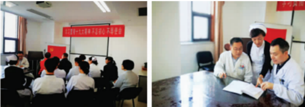
请退休老党员来讲党课，传承先辈志向，90后党员立志“三有青年”