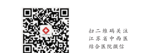
扫二维码关注江苏省中西医结合医院微信