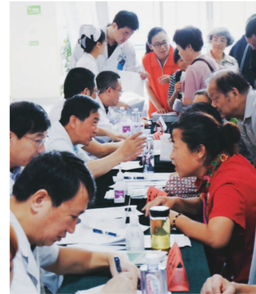
每年9月1日是广大莘莘学子开学的日子，预示着新的开端、新的起点、新的面貌、新的启航，然而今年的9月1日被赋予了另外一层特殊的意义：中国医师协会内镜医师分会内

微创胆胆专业委员会及中国非公立医疗机构协会胆石病专业委员会倡导设立9月1日为“胆囊健康日”。为了响应这个号召，也为呼吁人们养成良好的生活习惯，正确防治胆囊疾病，江苏省中西医结合医院在门诊大厅举办了“重视胆囊功能，关爱胆囊健康”为主题的义诊活动。