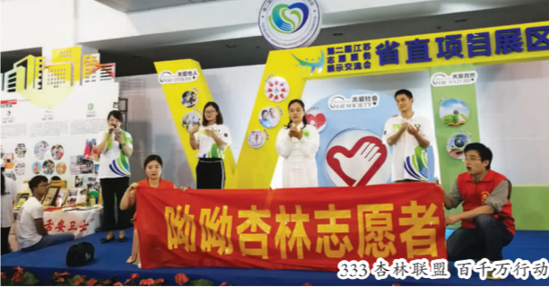
333杏林联盟 百万行动

由我院联合省中医院、省第二中医院合作的“333杏林联盟百万行动”(呦呦杏林志愿者联盟)项目也参与了评选，并吸引了大批观众观看咨询，收到了市民和志愿者们的一致好评。呦呦杏林志愿者联盟不仅带去了中药香囊、药茶、中药标本小书袋、药枕，还与时俱进的带去了掌上中药房经典套组，扫一扫药盒背面的二维码，就可了解到关于你想要知道的中药知识，受到了许多中医药爱好者的好评。我们还带去了耳穴埋籽、中医推拿、八段锦等特色服务项目，让