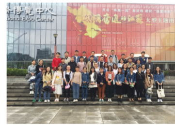
2017年10月11日下午，我院组织党员、规培学员共计45人前往南京国际博览中心1号馆参观“砥砺奋进

的江苏”图片展，喜迎党的十九大召开。 “砥砺奋进的江苏”大型主题图片展由中共江苏省委宣传部、江苏省委改革委员会主办，分为“序篇”“改革篇”“创新篇”“富民篇”“生态篇”“法治篇”“文化篇”“党建篇”和“结语”九个部分。另设有VR全景图片和视频体验区，共展出图片828幅、VR全景漫游图片108幅、VR视频1部、城市形象宣传片13部、H5创意作品15件、微视频15部，生动形象地展示了这5年江苏砥砺奋