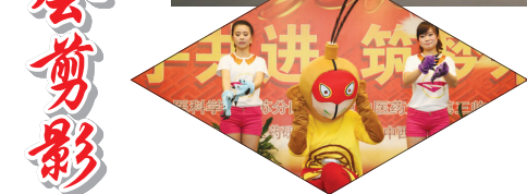
舞蹈《洗手舞》四病区