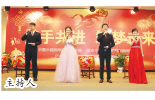
独唱《父亲的草原母亲的河》药学部