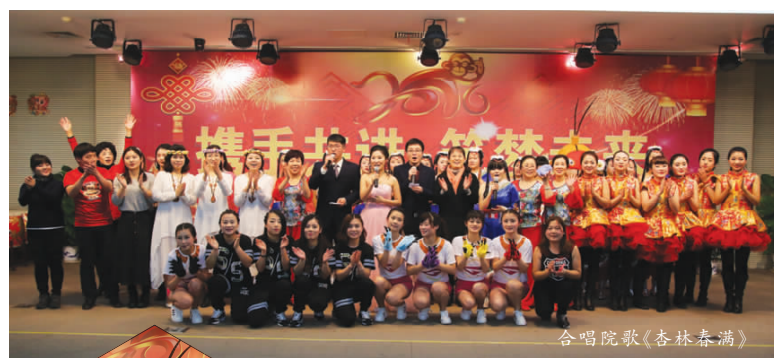
合唱院歌《杏林春满》