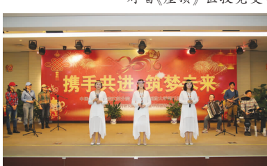
女生小合唱 妇产科