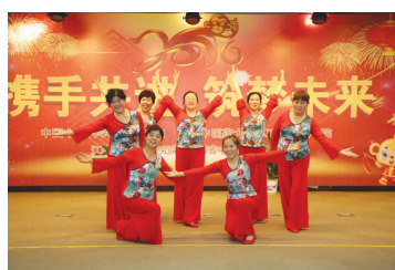
舞蹈《祖国之恋》工会离退休办