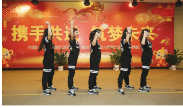
舞蹈《I will be back》骨科