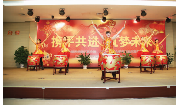
舞蹈《鼓舞新年》财务部