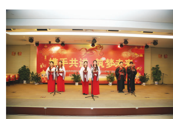
诗朗诵《中药人生》中药房