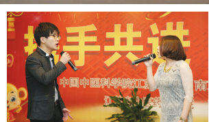
对唱《屋顶》医技党支部