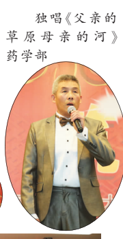
对唱《秋意浓》门诊党支部