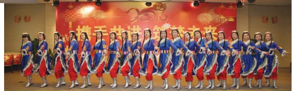
舞蹈《北西德勒》护理部