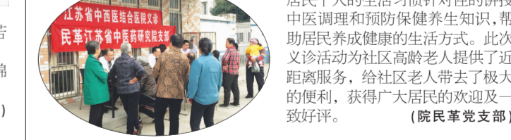
民革江苏省中医院民革支部

为不断提高居民的健康水平、增强健康保护意识,让居民不出社区就能享受到免费的医疗保健服务。11月4日下午,我院民革支部