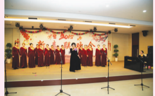
小合唱 红河谷 妇产科