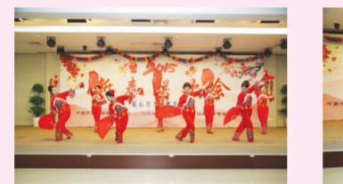
舞蹈 把爱唱出来 财务科