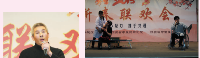
小品 特殊病人 药学部