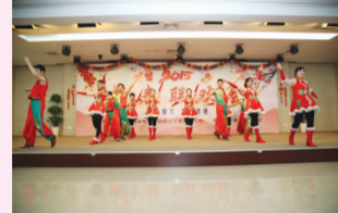
舞蹈 中国范儿 药学部