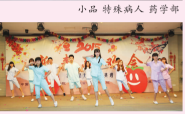
舞蹈 护士小苹果 四病区