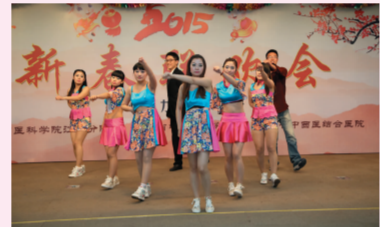
舞蹈 宫商角徵羽 骨伤科