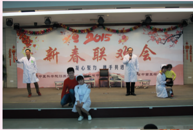
情景剧 阳光总在风雨后 团委