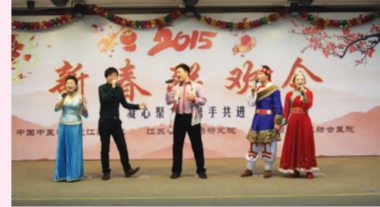
歌曲联唱 超声科 放射科 药学部