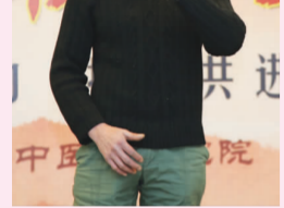
独唱 绿叶对根的情谊 药学部