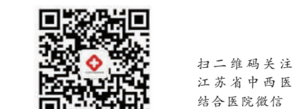
扫二维码关注江苏省中西医结合医院微信