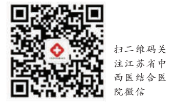
扫二维码关注江苏省中西医结合医院微信