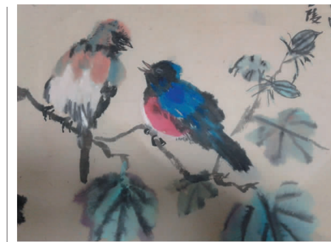
几处早莺争暖树 谁家新燕啄春泥 杨建国/画

和管理监督之下,时时自省,事事自警,牢记宗旨,就能防腐拒变。通过学习对照,既提高了自己的认识水平,又从反面教材中汲取了教训,从点点滴滴处严格要求自己。时刻牢记一个医务人员的标准,强化奉献意识、服务意识,自觉地做到一切以病人的利益为重,自尊、自省、自重、自律。始终把精力倾注在本职工作中,把握自己、管住自己、走好人生路。并决心在以后的工作和学习中,尽快克服和纠正,做到“两个始终坚持”。一是始终坚持廉洁的理想信念。注重提高自身思想觉悟和道德水准。同时,自己要严格要求自己,从思想深处根绝贪图享受、拜金主义、目无法纪等错误思想,不断反省自己,防微杜渐,