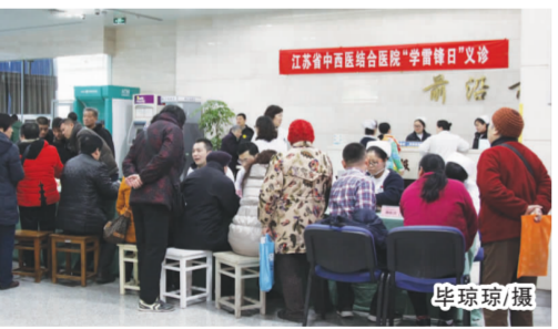
3月5日,在第52个学雷锋纪念日来临之际,恰逢传统元宵佳节,我院党员志愿者和青年文明号在医院门诊大厅开展学雷锋义诊活动。各党支部分别派出心血管、消化、内分泌、骨科、骨伤、妇产、普外、泌尿外、皮肤、急诊等10个科室的专家为广大患者提供免费医疗咨询,在义诊现场,专家们耐心详细地询问有关情况,针对性地开展健康指导;青年文明号派出青年志愿者为大家免费测量血压;本善社社工服务中心的医务社工也积极参与,为广大患者提供志愿服务。当天,共接诊200余人次,免去挂号费约2000元。

学雷锋义诊作为我院志愿服务活动的传统项目,现已成为党员志愿服务队、青年文明号和医务社工践行“奉献、友爱、互助、进步”志愿精神的有效载体,以实际行动传递着医务人员的爱心和正能量。(党办 团委)